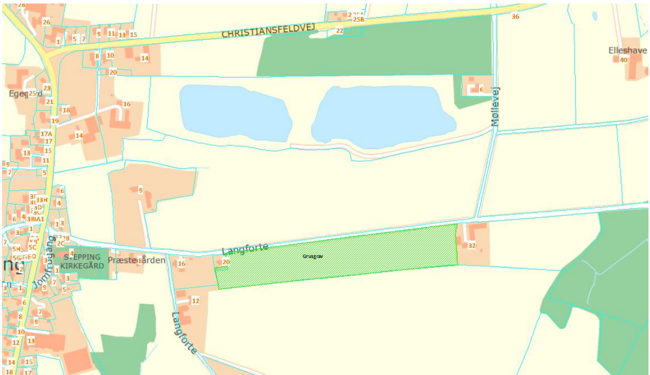
Billede 1. Oversigtsbillede.