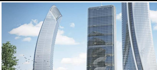
Libeskind og Zaha Hadid Towers