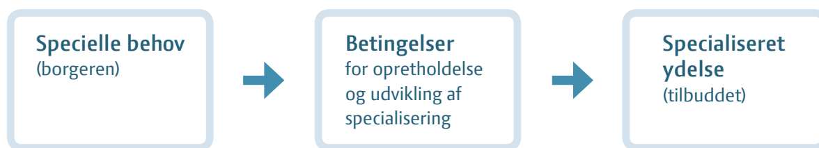
Figur 1 – specialisering som samfundsmæssig funktion

Betydningen af specialisering ligger gemt i sammenspillet mellem de tre elementer.